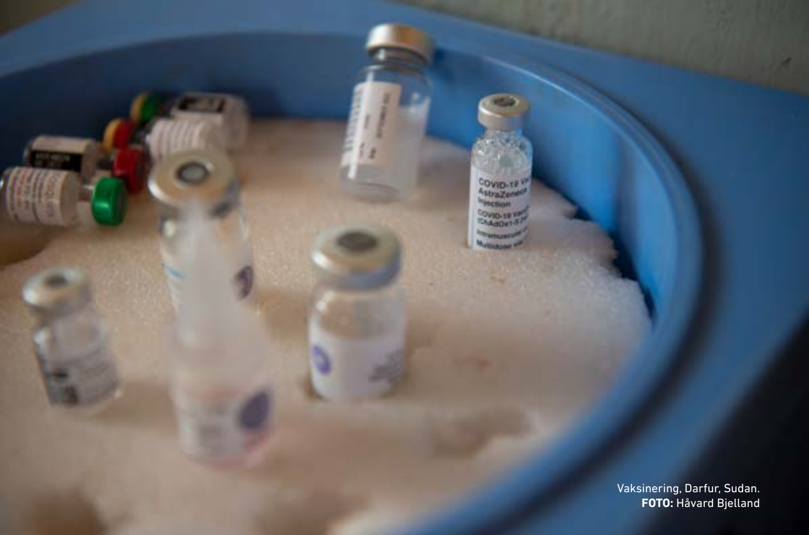
Vaksinering, Darfur, Sudan.