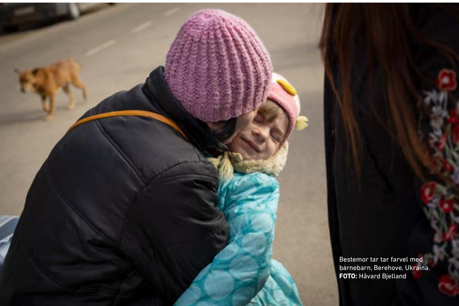
Bestemor tar farvel med barnebarn, Berehove, Ukraina.

Krigen i Ukraina gjør at mange OECD land igjen står overfor en flyktningstrøm. Det vil sette bistanden under press og andre viktige tiltak mot ulikhet og fattigdom vil kunne få sine budsjetter kuttet. Utviklingsminister Anne Beate Tvinnereim uttalte i spørretimen i Stortinget 9. mars at med unntak av 250 millioner foreslås milliard-bistanden til Ukraina finansiert utenfor det ordinære bistandsbudsjettet.