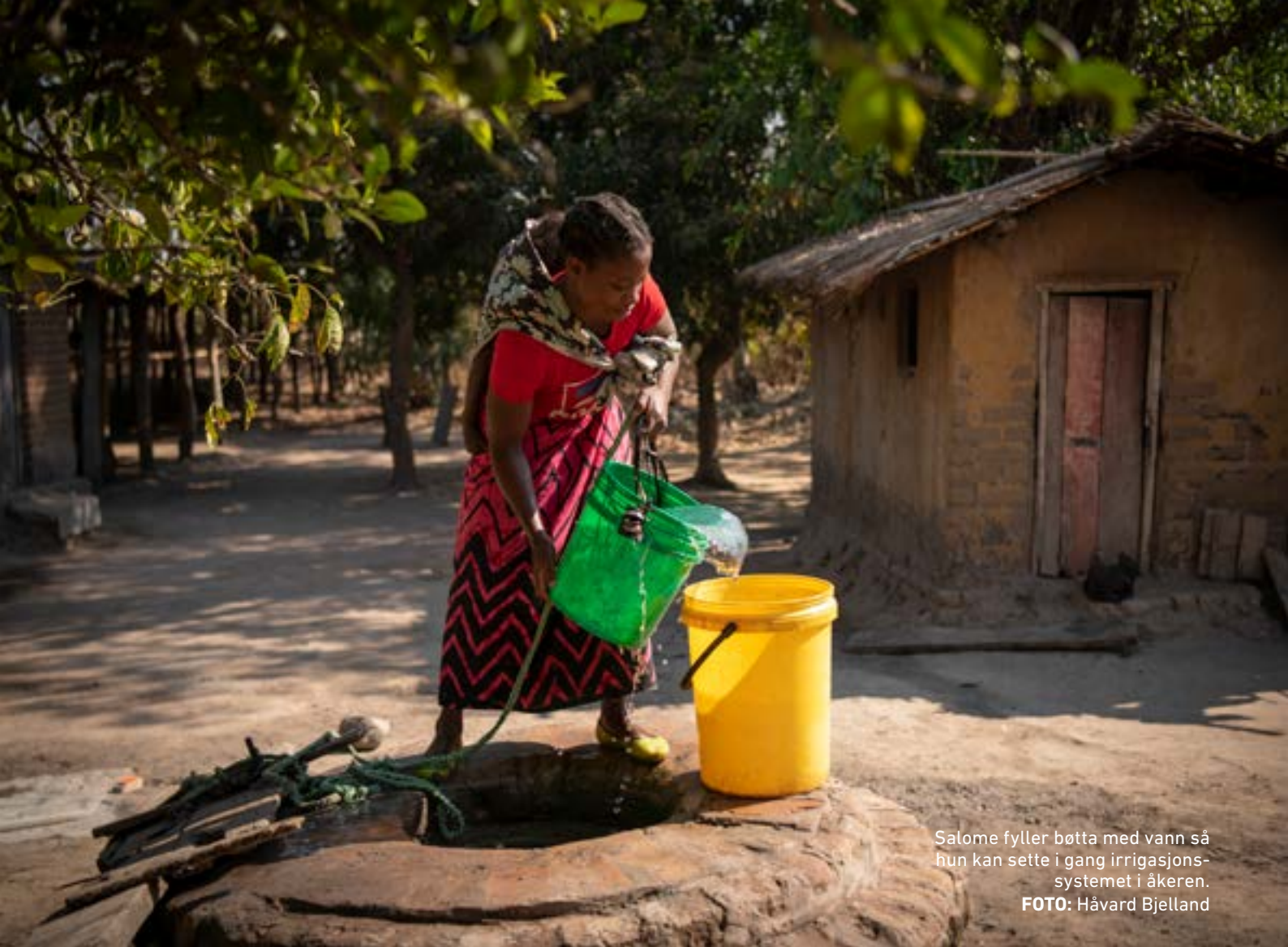
Salome fyller bøtta med vann så hun kan sette i gang irrigasjons-systemet i åkeren.