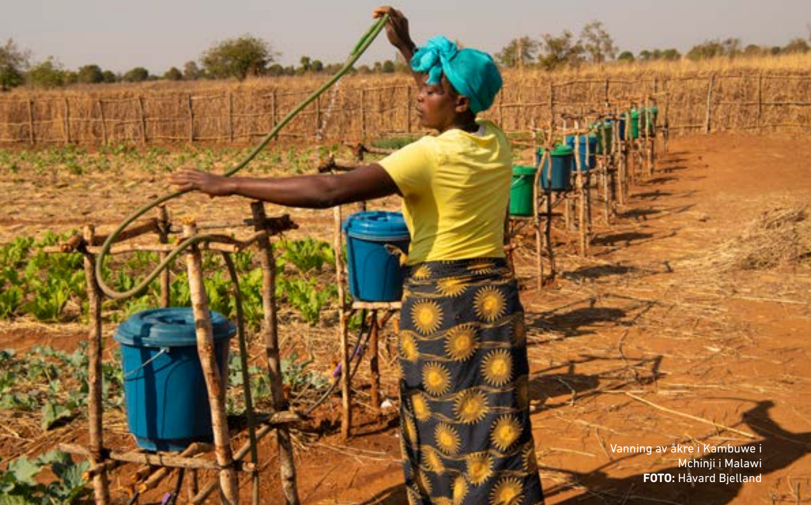
Vanning av åkre i Kambuwe i Mchinji i Malawi