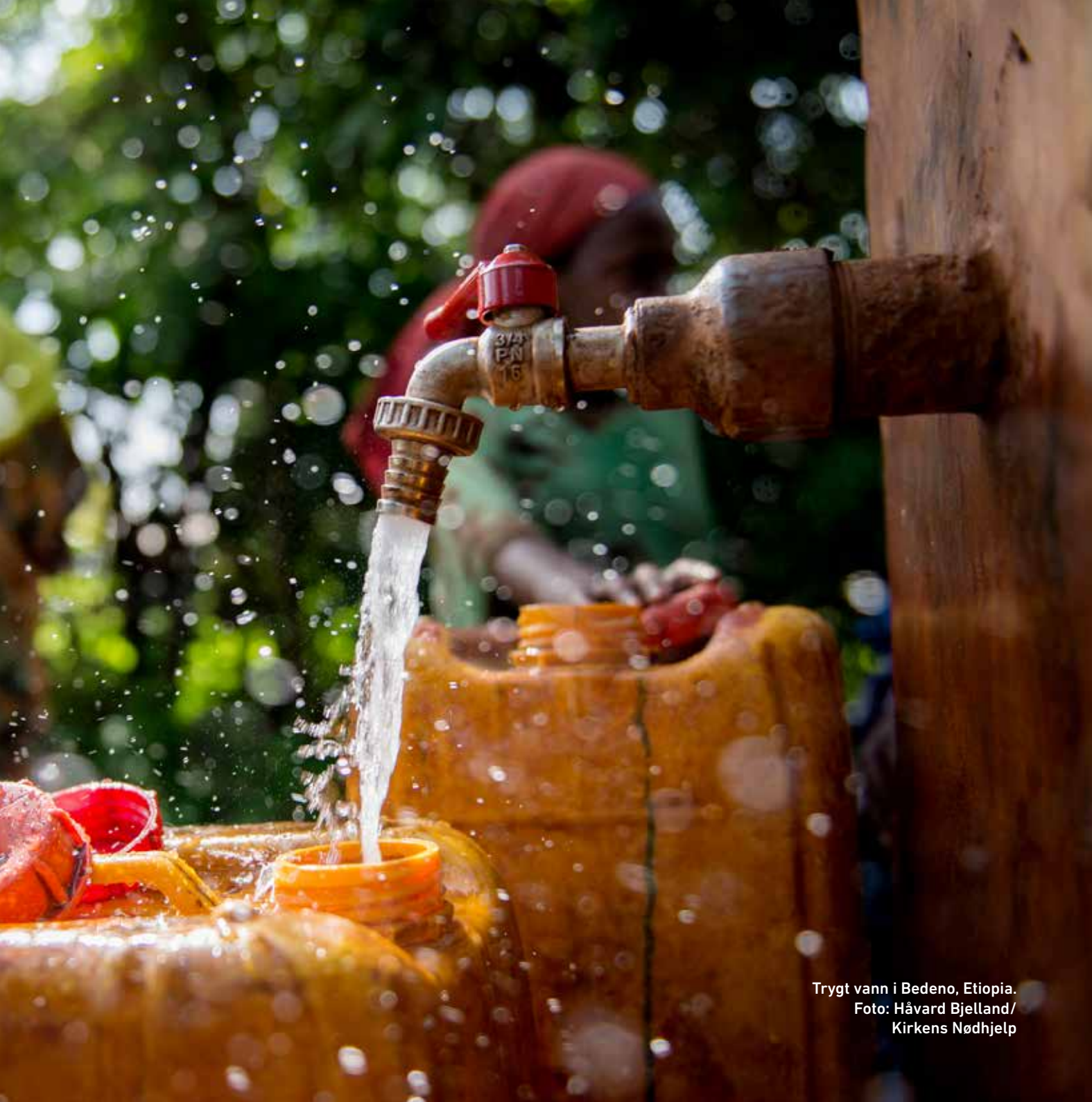
Trygt vann i Bedeno, Etiopia.